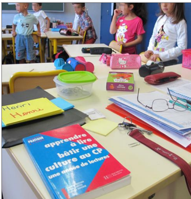
Une classe de CP. Toutes celles situées en réseau d'éducation prioritaire seront dédoublées à la rentrée. L'année suivante, ce sera le tour des CE1.